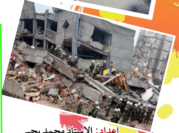
اعداد: الاستاذ محمد يحيى

هل تعلم ان التمساح لا يستطيع إخراج لسانه من بين فكاه