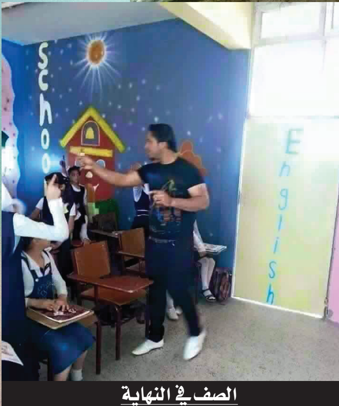
الصف في النهاية