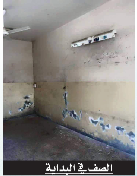
الصف في البداية

ليس غريبا على الانسان المرابي ان يكون شغوفا بحياة جميلة المظهر والالوان، معلم في العاصمة بغداد يقوم بصيغ وتعديل وتزيين الصف على نفقته الخاصة لكي يبدو بشكل أجمل للتلاميذ، قبل ان يبدأ العام الدراسي الجديد .