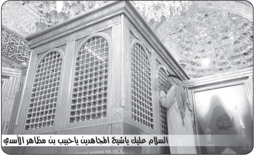
السلام عليك يا شيخه اجاهدين يا حبيب بن مظاهر الأسدي