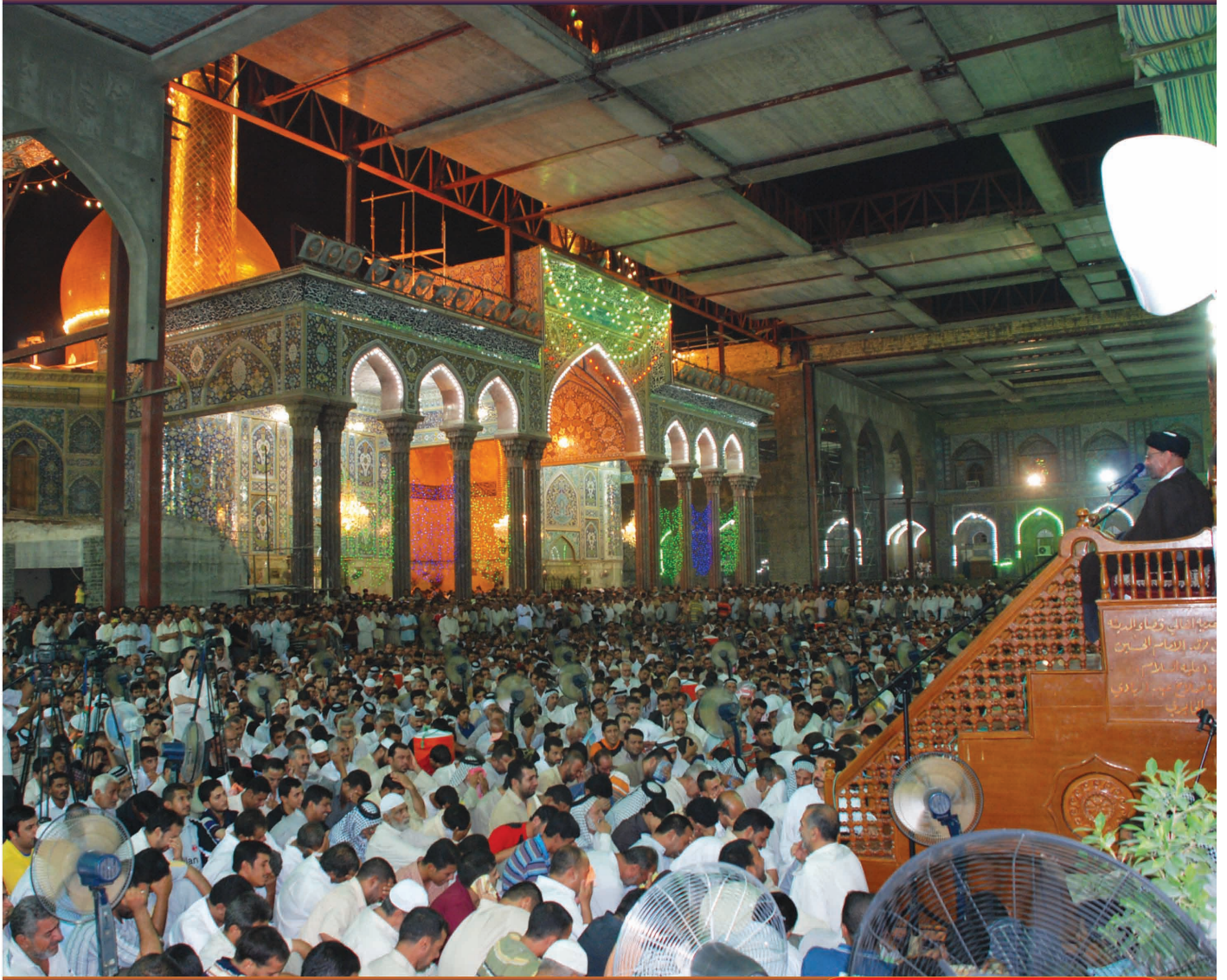
أحدى مجالس الوعظ والارشاد الرمضانية المقامة في الصحن الحسيني الشريف ليلة الجمعة ١٠ رمضان ١٤٢٩ هـ