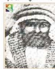
شيخ حسري المحمود

بعد ان استكملوا استعداداتهم لغزو منطقتة الخليج من خلال عقد عدة اتفاقيات مع الشيخ خزعل والشيخ مبارك وعبد العزيز آل سعود وكانت بريطانيا تدرك موقف علماء الشيعة من احتلال العراق حيث لا يمكن أن يتقبلوا أي احتلال اجنبي استعماري للأقاليم الإسلامية وقبل أن تعلن بريطانيا الحرب على إيران والدولة العثمانية صدرت الأوامر إلى القوات البريطانية في يومئذ بالتحرك نحو الخليج في ١٤ تشرين الثاني ١٩١٤م - ٢٥ ذي الحجة ١٣٣٢ هجرية فاحتلت الفاء، ولما رأى الشيرازي الخطر محققاً شكل مجلساً استشارياً من علماء كربلاء المقدسة ووجه الدعوة إلى رؤساء العشائر الشيعية في الجنوب وبدأ نشاطه لمنع الانكليز من تحقيق مآربهم وبدأت حركة الجهاد في العراق لتصد الجيوش البريطانية من جهة البصرة وانطلقت من كربلاء وباقي المدن العراقية فكانت اول مجموعة من المجاهدين بقيادة محمد سعيد الحويبي توجهت نحو الجنوب وكانت تلتحق بهم في الطريق العشائر والمجاهدون ولما علم الانكليز أن قلب الثورة هي كربلاء المقدسة توجه الميجر بولي إلى كربلاء مع قوة مجهزة بالسيارات المصفحة والمدافع فطوقت مدينة كربلاء في يوم الأحد الخامس من شوال سنة ١٣٣٨ هجرية واستعد الثوار وابتداء المدينة الى مواجهة المحتلين أول منصب رسمي وتشكيل حكومة عراقية مستقلة في كربلاء المقدسة.