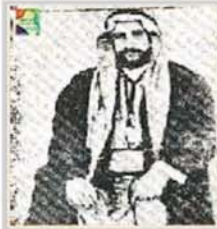
الشيخ شعلان أبو الجون