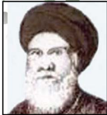
السيد المرتضى (قدس سره)