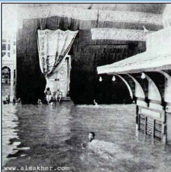
www.alshaker.com صورة نادرة للحرم أخذت عام ١٩٤١ م ومستوى المطر يصل الى الحجر السود والطواف حول الكعبة .... بالسباحة