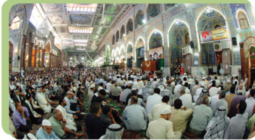
■ مستقاة من الخطبة الأولى لسماحة الشيخ عبد المهدي الكربلائي في ٢٠١٠/٦/١٨

بها الإنسان، وهناك نعم كثيرة يجب أن يستشعر بها الإنسان.. وان يلاحظ ما يعيش فيه الآخرون، ولا ينظر إلى من هو فوقه، لا في الصحة، ولا في المال والسلطان والجاه والأولاد، بل ينبغي أن ينظر إلى من هو فوقه في تقواه وحسن سيرته ومعاشرته والتزامه بأحكام الله تعالى.. ويحاول الاقتداء به حتى يصل إلى تلك المرحلة .. وأما من هو أفضل مني في النعم لا انظر إليه.. بل انظر إلى من هو دوني، فربما هناك الكثير ممن سلبوا لابتلاء أو غير ذلك من الأسباب، سلبوا من هذه النعم، انظر إلى هؤلاء وأقول الحمد لله والشكر لله، فأنا لم أسلب هذه النعم.