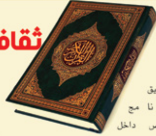
تطبيق برنامج خاص داخل