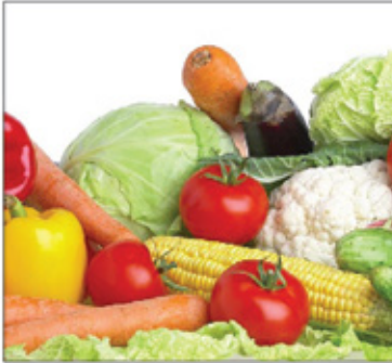
يقوي الذاكرة ، ويزيد مستويات اليقظة الذهنية.

العدس واللحم . هناك فيتامينات ضرورية للجسم ، و يحتاجها في مكافحة بعض الأمراض ، مثل : فيتامينات B بأنواعها ، تساعد في تخفيف حدة الاكتئاب والتوتر ، ويحتاج الجسم إلى فيتامين B6 إضافة للمكملات الغذائية ، وحبوب الشوفان تحول دون الإصابة بتقلبات المزاج ، وتساعد على حفظ مستويات السكر في الدم ، و فيتامين E ، يساعد على دعم حركة الدم وعملية نقل الجلوكوز والأكسجين إلى الدماغ ، ويعتبر مضاداً مهماً للأكسدة ، ويحمي خلايا الدماغ من الضرر والتعرض للشف . ومن الأغذية الغنية بفيتامين E : البيض والمايونيز والحليب و سمك السلمون والبطاطا الحلوة وال فول السوداني و الخضراوات ذات الأوراق الخضرة الداكنة والخس ، و فيتامين B6 من المغذيات ، التي تشتمل الدماغ ، و يتوفر في البيض و