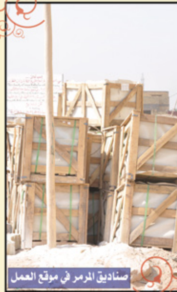
صناديق المرمر في موقع العمل