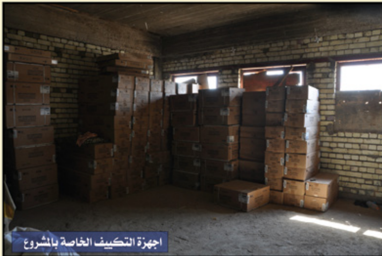
اجهزة التكييف الخاصة بالمشروع