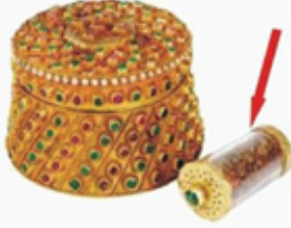
تراب قبر الرسول الأعظم محمد (صلى واله)