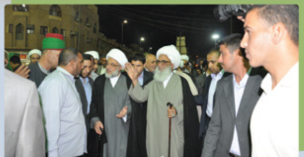
المرجع الديني سماحة الشيخ بشير النجفي (دام ظلّه) يزور مرقد الإمام الحسين ويلتقي أمين عام العتبة الحسينية المقدسة