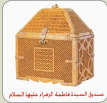
صندوق السيدة فاطمة الزهراء عليها السلام