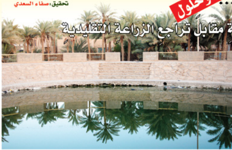
تحقيق: صفاء السعدي

العيون الصافية والتخيل الباسقة والمناظر الخلابة والحضرة الأخاذة من كثرة الأشجار وتنوع الثمار يشدك أيما شد للفاعل مع المكان الذي كان يوماً من الأيام سلة ليس لأهلها فحسب بل سلة لجميع أبناء المنطقة الغذائية ومتنفساً يلوذه به كل من اعتلى الهم قلبه أو دأبهم نوع من أنواع الضجر، وترآكم عليه الروتين وعاديات الزمن الأغر، تراه يذهب إلى هناك ليزيل الهم والغم ويترجمه عن قلبه وعن نفسه لتعود طرية وفيها من الحيوية والنشاط تساعده للانقضاض على مشاكل الحياة التي تعتوره، والوقت لم يض بعد لإعادتها إلى سابق عهدها أو أحسن بالرغم من شحة مياه الأنهار والبحيرات ونضوب المياه الجوفية، فإن ثمة سواعد ونية قادرة على ابتكار طرق حديثة في الري لانعاش تلك المنطقة ودفعها لكي تحتل مركز الصدارة في العطاء والسياحة.