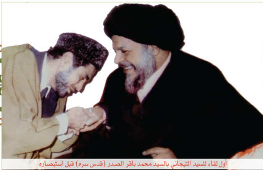
أول لقاء للسيد التيجاني بالسيد محمد باقر الصدر (قدس سره) قبل استبصاره