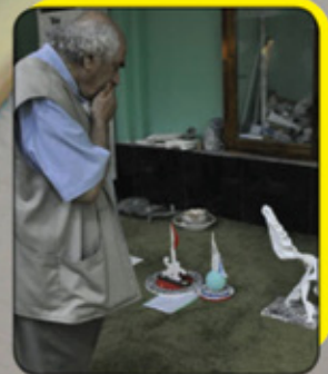
التشكيلي الراحل محمد غني حكمت يزور العتبة الحسينية المقدسة