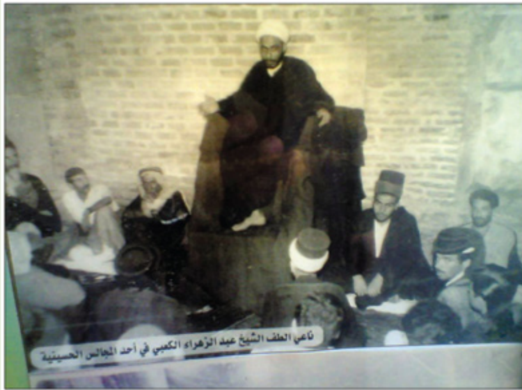
نائب العلف الشيخ عبد الزهراء الكعبي في أحد المجالس الحسينية