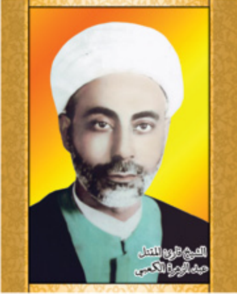
الشيخ الزهراء الكعبي