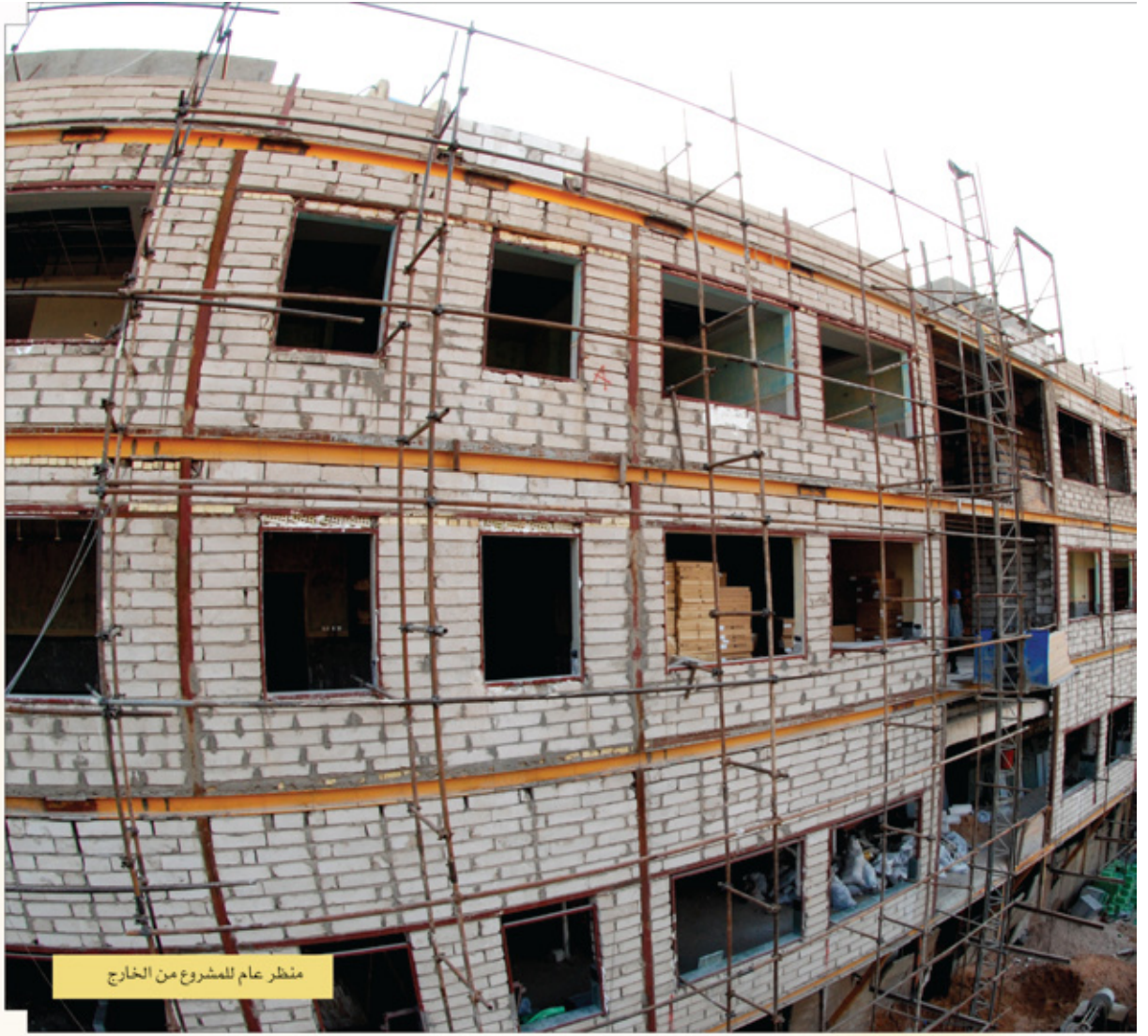
منظر عام للمشروع من الخارج