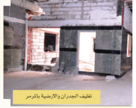
تغليف الجدران والارضية بالترمر