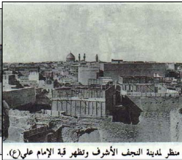
منظر لمدينة النجف الأشرف وتظهر قبة الإمام علي (ع).