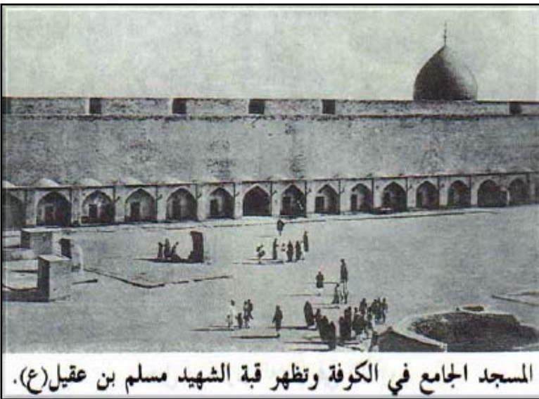
المسجد الجامع في الكوفة وتظهر قبة الشهيد مسلم بن عقيل (ع).