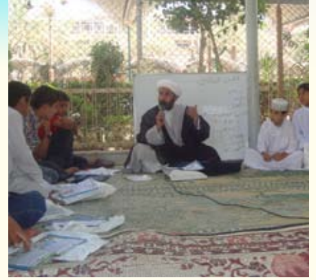
تقرير: علي الجبوري

وأشار إلى أنه من "ضمن نشاطات طلاب دوراتنا الصيفية أنهم رقدونا بمواضيع عديدة تمكنا من خلالها ومن خلال مشاركات أساتذتهم الكرام من إصدار مجلة شهرية