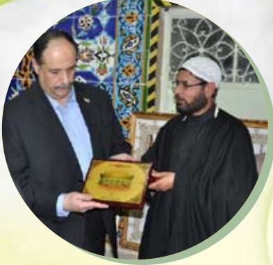
العتبة الحسينية المقدسة توقع مذكرة تعاون (قرآنية) مع السفير المصري في العراق

تصدر اسبوعيا عن قسم الإعلام في العتبة الحسينية المقدسة / ديوان الوقف الشيعي - السنة السابعة الخميس / ٢٦ / محرم الحرام / ١٤٣٣ هـ الموافق ٢٢ / ١٢ / ٢٠١١