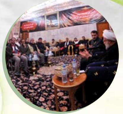
الأمين العام للعتبة المقدسة يلتقي وفد الهلال الأحمر الإيراني عقب زيارة عاشوراء