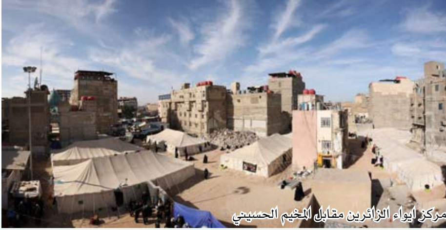
مركز إيواء الزائرين مقابل المخيم الحسيني

أشارَ عضو في مجلس إدارة العتبة الحسينية المطهرة إلى إن الأمانة العامة للعتبة المطهرة حرصت على تقديم خدمات نوعية ومتميزة لزائري أربعينية الإمام الحسين (عليه السلام) لهذا العام، مشيراً إلى أنها قامت «بنشر خمسة مواكب خدمية على الطرق الخارجية المؤدية للمدينة المقدسة لتقديم أفضل الخدمات للزائرين».