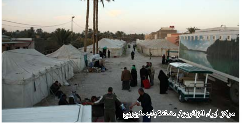
مركز ايوام الزائرين // مطبخة باب طويريج

سواق، بالإضافة الى ٢٥٠ متطوعاً من الرجال والنساء، وتم توفير ٧٠ منشأة صحية للرجال و٥٥ للنساء وقمنا كذلك بإنشاء وحدة صحية جديدة للغسالات حيث يتم غسل ملابس الزائرين عبر كادر خاص لهذا الغرض، كم قمنا بتوزيع الملابس لان الجو بارد فمثلاً وزعنا الكفوف ووزعنا ملابس بلون اسود مطرزة بكلمات يا حسين والسلام عليك يا ابا عبد الله .. للأطفال من عمر الأشهر الأولى الى حد عمر ١٢ سنة وكذلك ملابس نسائية».