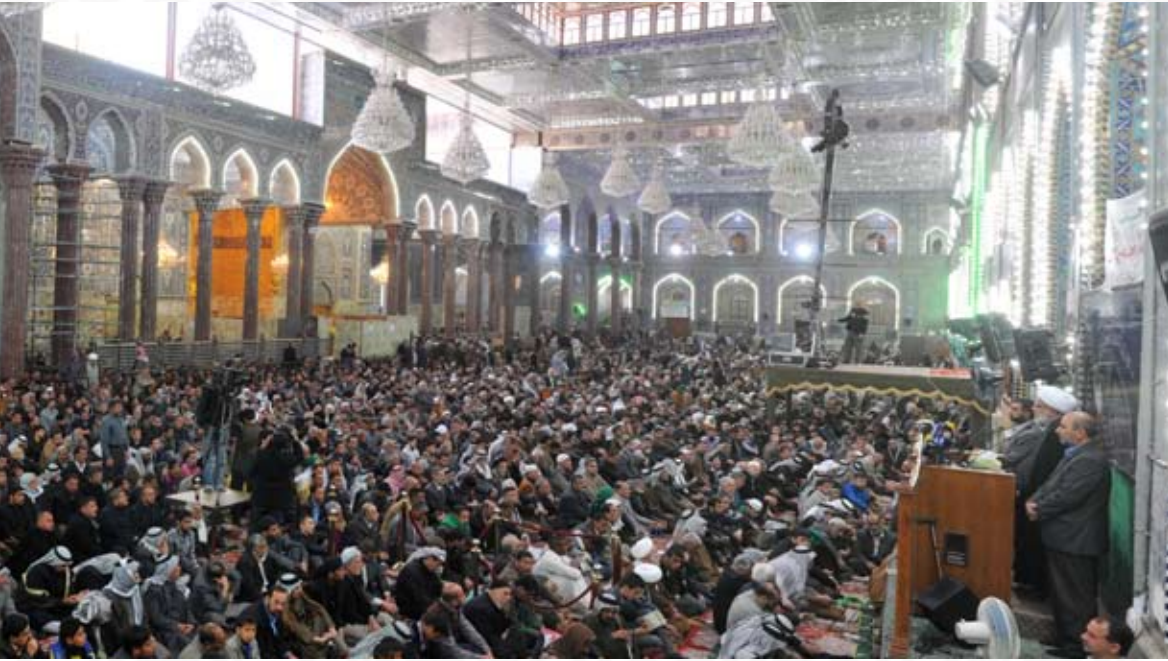
تقرير : حسن الهاشمي