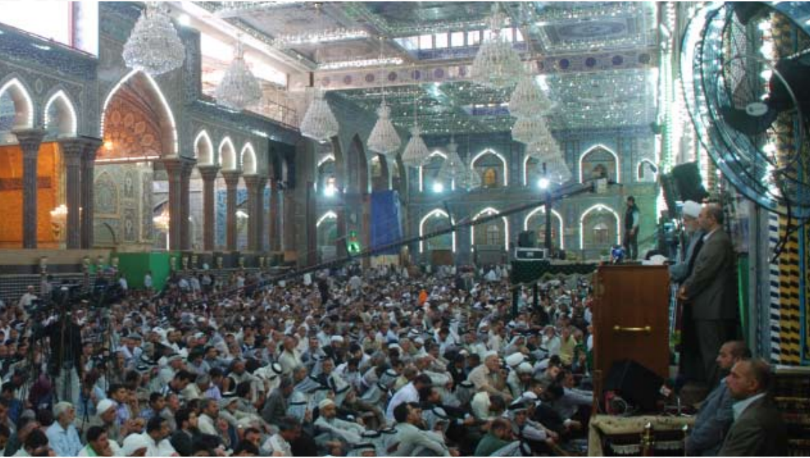
تقرير: حسن الهاشمي