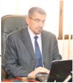
مدير اعلام الجامعة