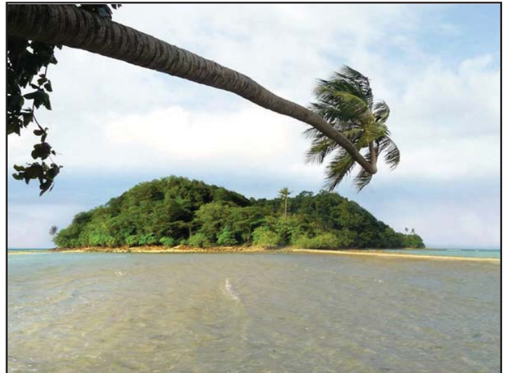
سبحان الخالق وجمال الطبيعة وبراعة المصور