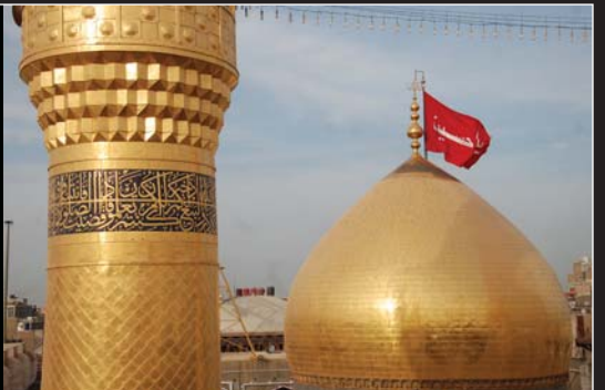
صور من العتبة الحسينية المقدسة