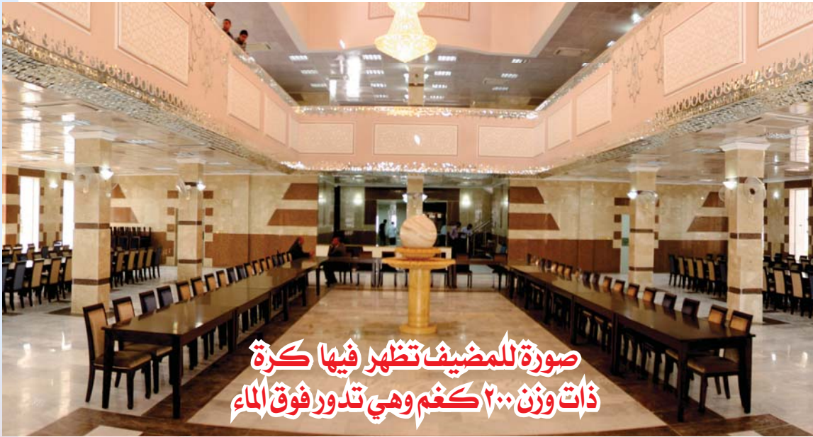
صورة للمضيف تظهر فيها كرة ذات وزن ٢٠٠ كغم وهي تدور فوق الماء

وأضاف الشكري في معرض حديثه، «بعد ان بسّست شخصياً من طبيعة تنفيذ المشاريع في العراق استعدت الأمل حينما قدمت وبرفقة سماحة الشيخ الكربلائي وأنا أتجول وأشاهد مشاريع العتبة المقدسة فعدت الى بغداد والأمل يحدوني بتنفيذ مشاريع الحكومة العراقية بنفس الآلية والمثابرة والإخلاص»، مبيناً ان «مدينة الزائرين متميزة