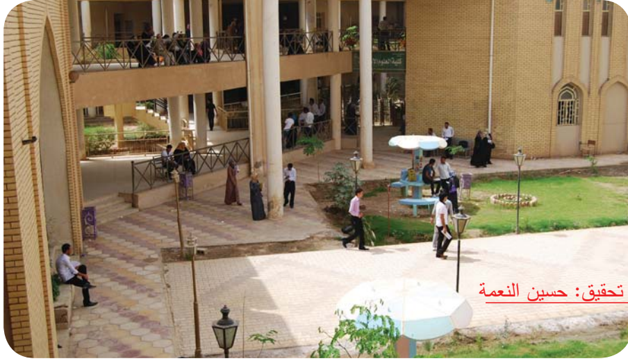
تحقيق: حسين النعمة

كربلاء، «يبدو أن قرار الالتحاق بكلية معينة صعب ومحير لدى معظم الشباب»، مبيناً إن «أهم شيء يجب على الطالب أن يضعه في اعتباره عند اختياره الكلية التي ينوي الالتحاق بها هو (الميول) إذ يجب أن يختار الدراسة التي تتناسب مع مزاجه الشخصي؛ لأن ذلك قد يجعله سعيداً طوال العمر وبالتالي سيخلد إلى راحته النفسية». وأضاف الدعيمي، «ان هناك أمراً ثانياً هو القدرات الذهنية والبدنية ومدى التفاعل مع المجتمع، فلا يصح مثلاً أن يقرر دراسة العلاقات العامة أو التسويق رغم أنه يحب الانفراد بنفسه، ولا يميل