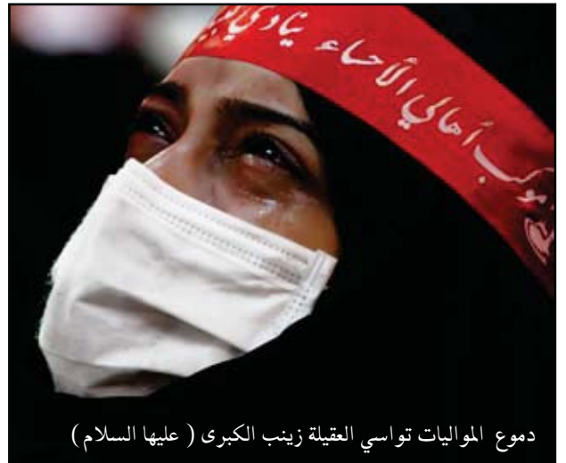
دموع الموايات تواسي العقيلة زينب الكبرى (عليها السلام)