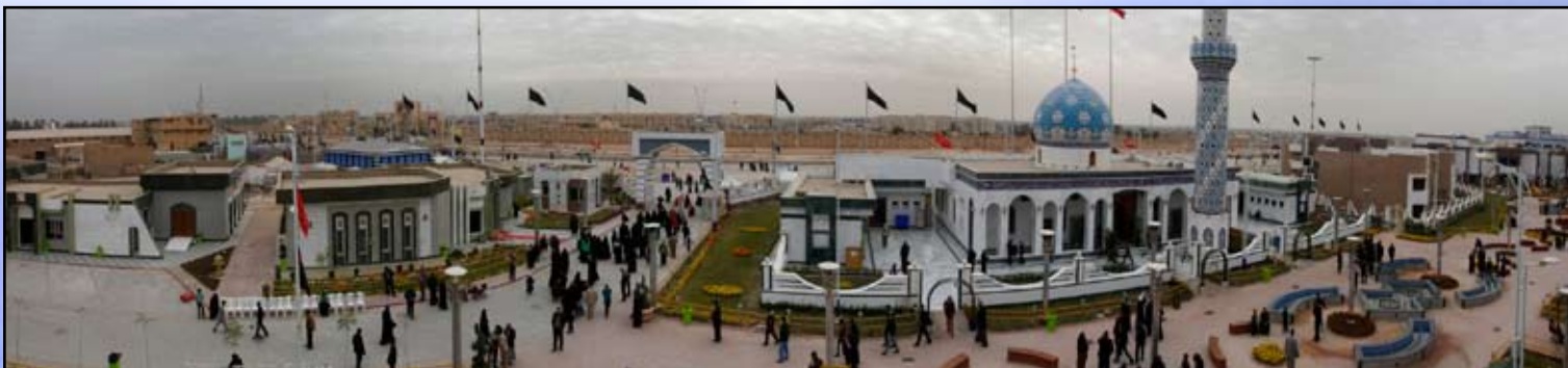
مدينة زائري الامام الحسين عليه السلام التابعة للعتبة الحسينية المقدسة طريق كربلاء- بابل

وارحم تلك القلوب التي جزعت واحترقت لنا و وارحم تلك الصرخة التي كانت لنا اللهم إني أستودعك تلك الأنفس وتلك الأبدان حتى ترويهم من الحوض يوم العطش