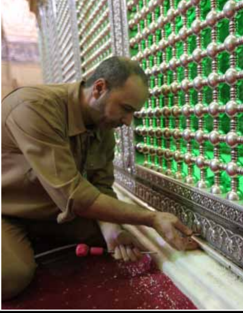
اول قطعة رفعت من الضريح القديم