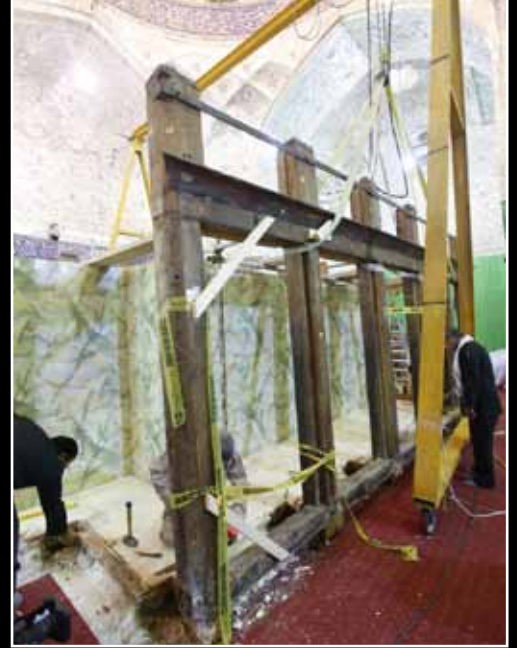
آخر قطعة رفعت من الضريح القديم

يوم ٢٧ كانون الثاني بدأت اعمال تنصيب الشباك الجديد وكان اول عمل لهم هو تثبيت الاساس الذي سيثبت عليه الشباك وكانت عملية دقيقة لضبط استقامة التثبيت من غير اعوجاج او ميلان وقد استغرقت العملية اي الحفر والصب والتسليح وتثبيت القواعد الحديدية المغلونة لغاية ٥/ شباط الموافق ٢٤ ربيع الاول حيث تم الشروع بنصب الهيكل الخشبي ، وفي ٩/ شباط بدأ نصب الشبايبك وكان اول شباك نصب هو من جهة الرأس الشريف واستمر العمل وتم تثبيت كل الشبايبك باستثناء واحد من جهة علي الاكبر عليه السلام لغرض انجاز الاعمال الداخلية للضريح .