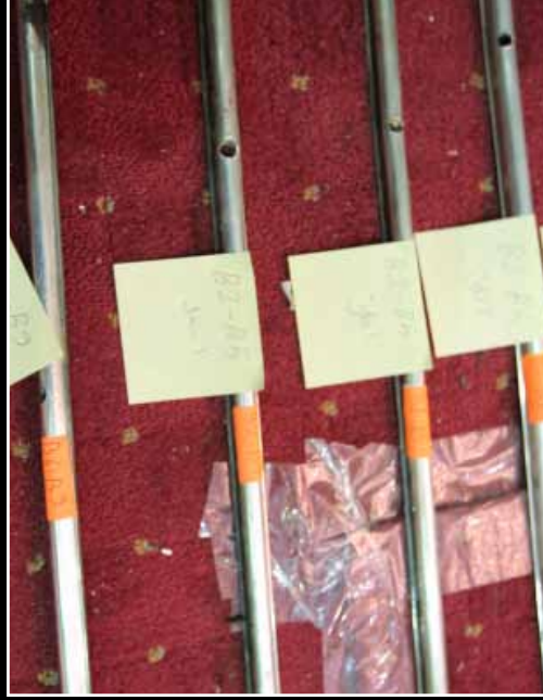
تغليف اول قطعة رفعت من الضريح القديم