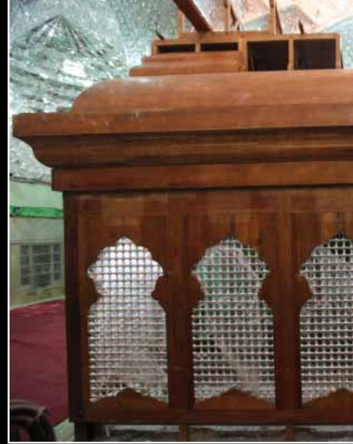
الذهب قبل التذهيب

الجميع يود ان يحضر هذا الافتتاح وهي مسألة حب واعتقد ان الافتتاح سيكون مستمراً وسوف لا يستمر لساعات معدودة وسيتم هذا الافتتاح لأيام وأشهر وكلما يأتي الزائر ويشاهد الضريح الحالي ويتذكر الضريح السابق يدرك ان العاملين قد اجادوا في عملهم.