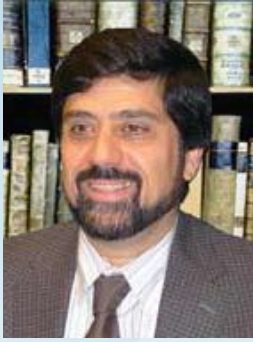
بقلم: نزار حيدر