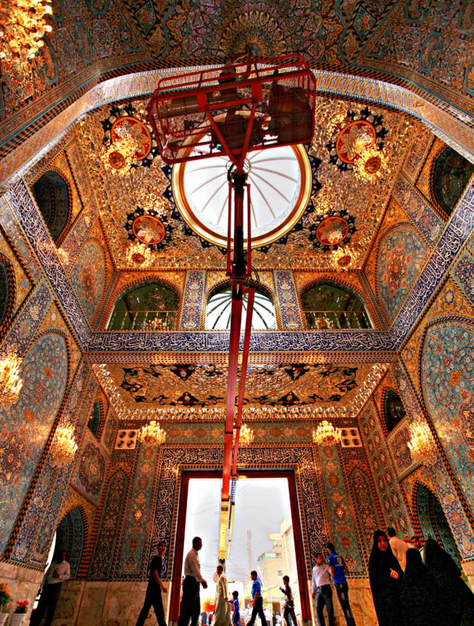
أعمال التنظيف أعلى باب الرأس الشريف