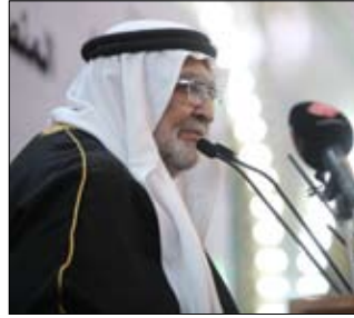
الشيخ عامر العزاوي