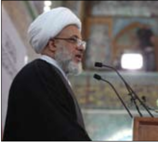
الشيخ عبد المهدي الكربلائي