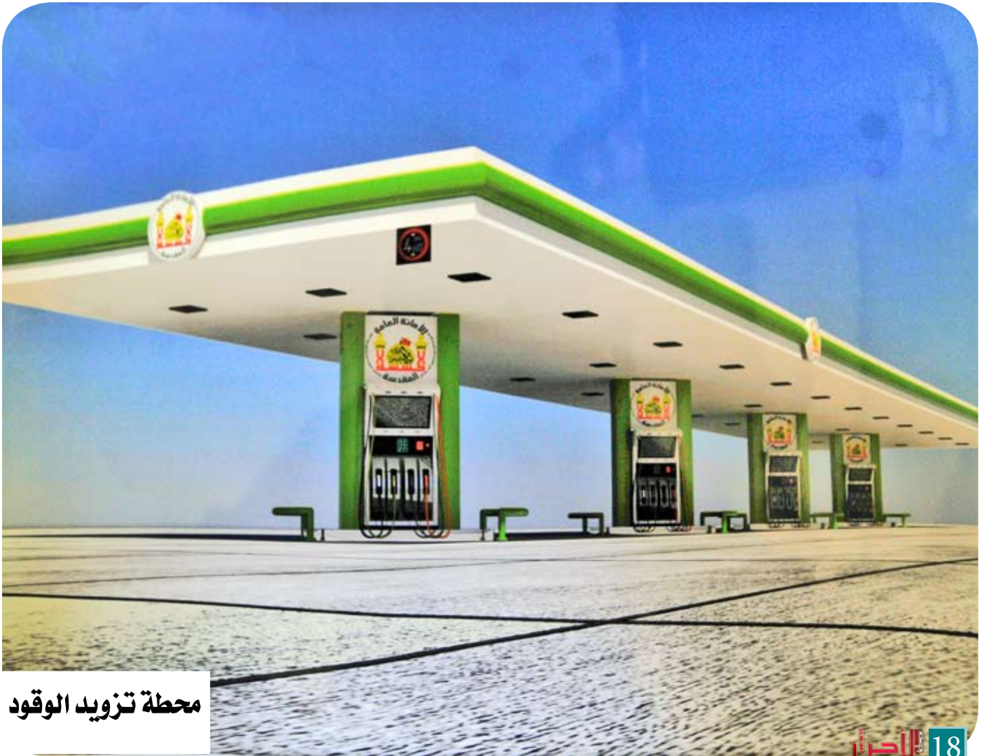
محطة تزويد الوقود

"إنشاء موقف للمركبات بمساحة (١٦ ألف م٢)، وتمّ تخصيص مساحة (١٠ آلاف م٢) لوقوف الباصات الكبيرة والصغيرة بعد تسقيفها وتزويدها بمدخلين ومخرجين ومراعاة انسيابية حركة المركبات في تصميم الأعمدة والمسقفات وتمّ تصميم هذه المساحة لاستيعاب (٦٠٠) مركبة صغيرة وكبيرة، أما المساحة المتبقية فقد تمّ إنشاء كراجين مساحة الواحد منهما (٣ آلاف م٢) يستخدم للأليات الثقيلة مثل القلابات والحفارات وسيارات الحمل (التريلات)، مع تخصيص مساحة (٢٠ ألف م٢) لإلحاقها بالكراج مستقبلاً لاستخدامها في استيعاب السيارات