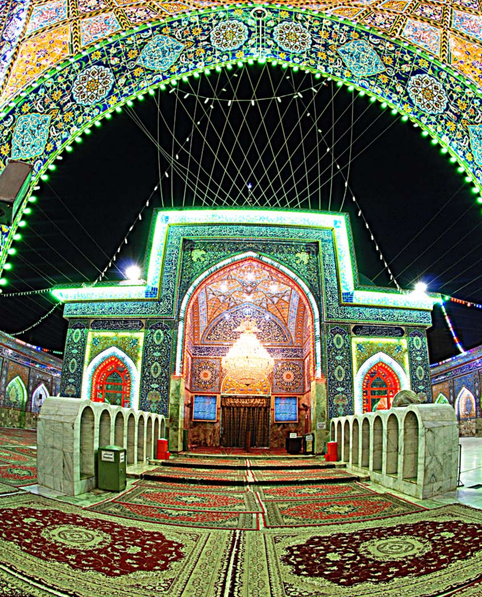
المخيم الحسيني المشرف