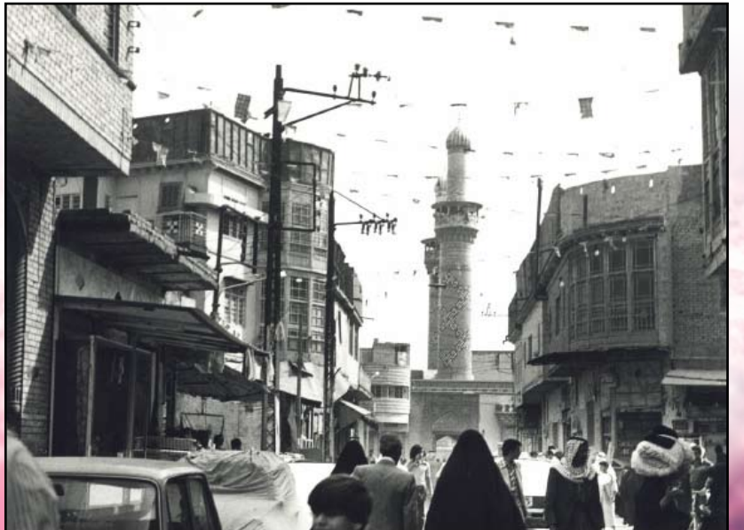
شارع صاحب الزمان