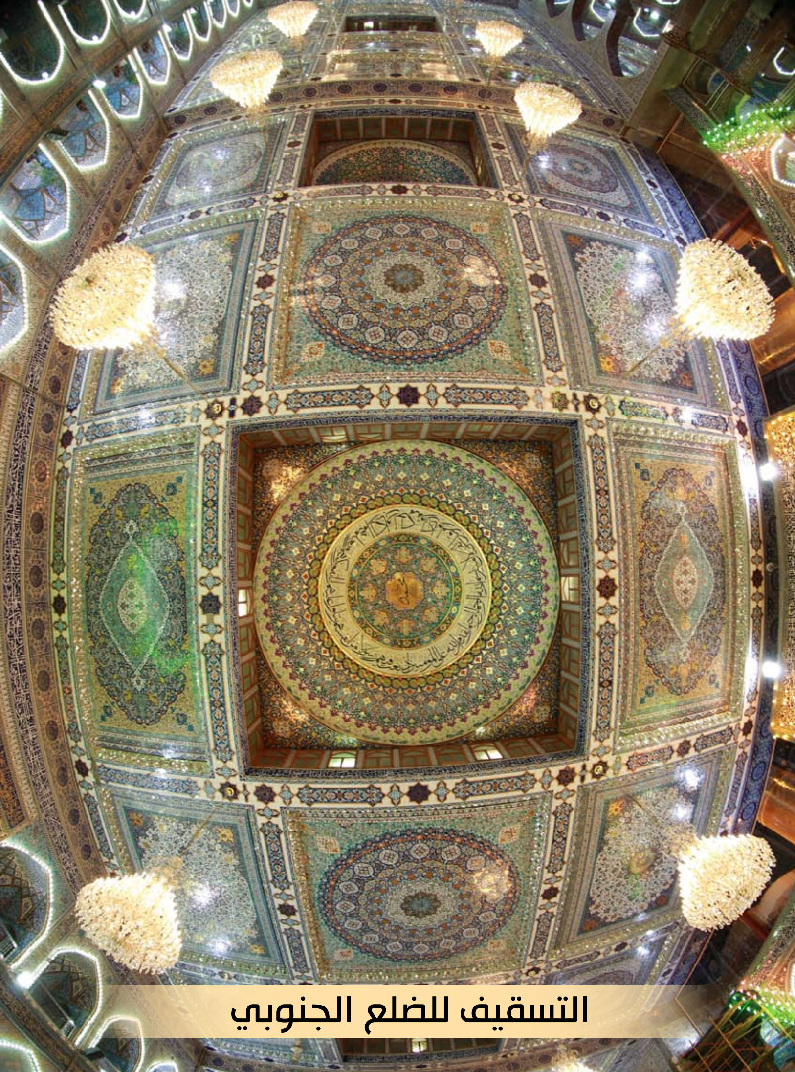
التسقيف للضلع الجنوبي