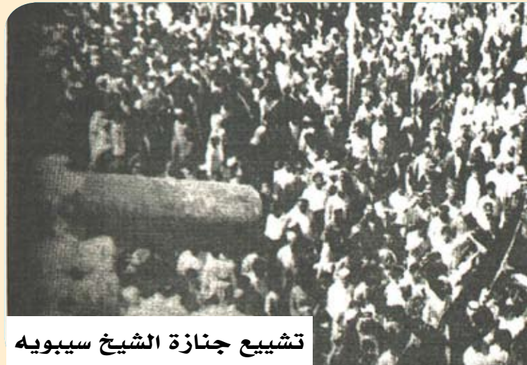
تشييع جنازة الشيخ سيبويه

من اعلام كربلاء ص ١٦٥، نقباء البشر ج٤ ص ١٦٠٣، من اعلام الفكر في كربلاء ج ١ ص ٢٠١، حوادث الايام ج ١ ص ٤٣٥، وغيرها.