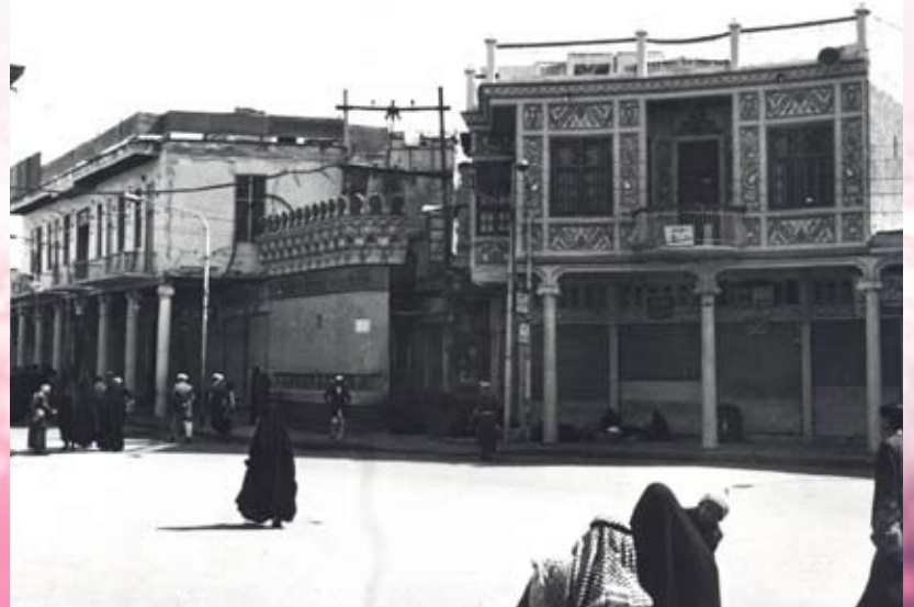
صورة من الارشيف ( ساحة الصافي ) في كراچاء