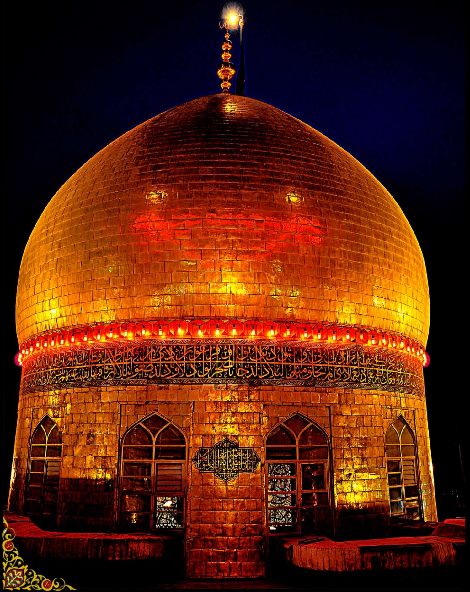
﴿عَلَيْهِمُ السَّلَام﴾ قبة حرم الامام الحسين