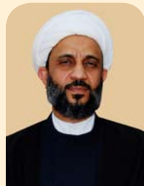
الشيخ لوث الضائع

ويوضح ان «لحالة الطلاق نتائج سلبية بصورة عامة تؤدي الى التفكك الأسري وكلما كانت المرحلة العمرية