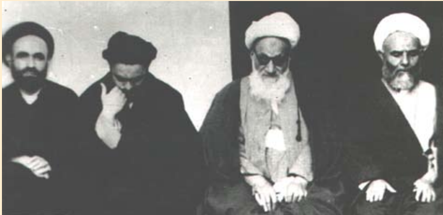
الشيخ يوسف الخراساني ، الشيخ محمد رضا الاصفهاني ، السيد محمد الشيرازي ، السيد احمد الخاتمي

من اعلام الفكر في كربلاء ج ١ ص ٤٩، من اعلام كربلاء ص ١٩٥، فهرس التراث ج ٢ ص ٥٣١.