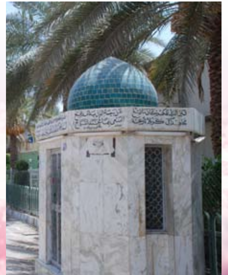
مرقد السيد محمد الطباطبائي أخذت سنة ١٩٧٧م