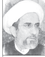
الشيخ حبيب الكاظمي

لو اعتقد العبد - يقينا - بإحاطة الشياطين ( لقلوب ) الذين يتولونه ، (و لأماكن) المعصية ، لاشتد وحشته من