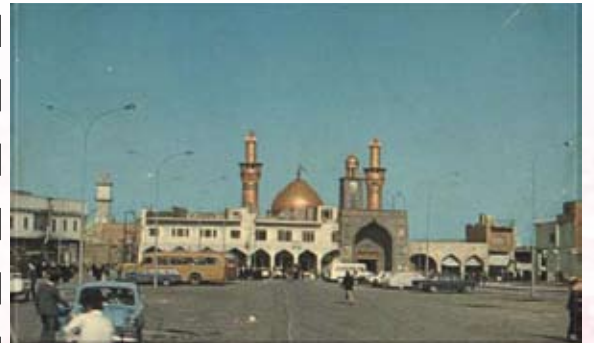
باب قبلة الامام الحسين قبل ما يقارب الاربعين عام