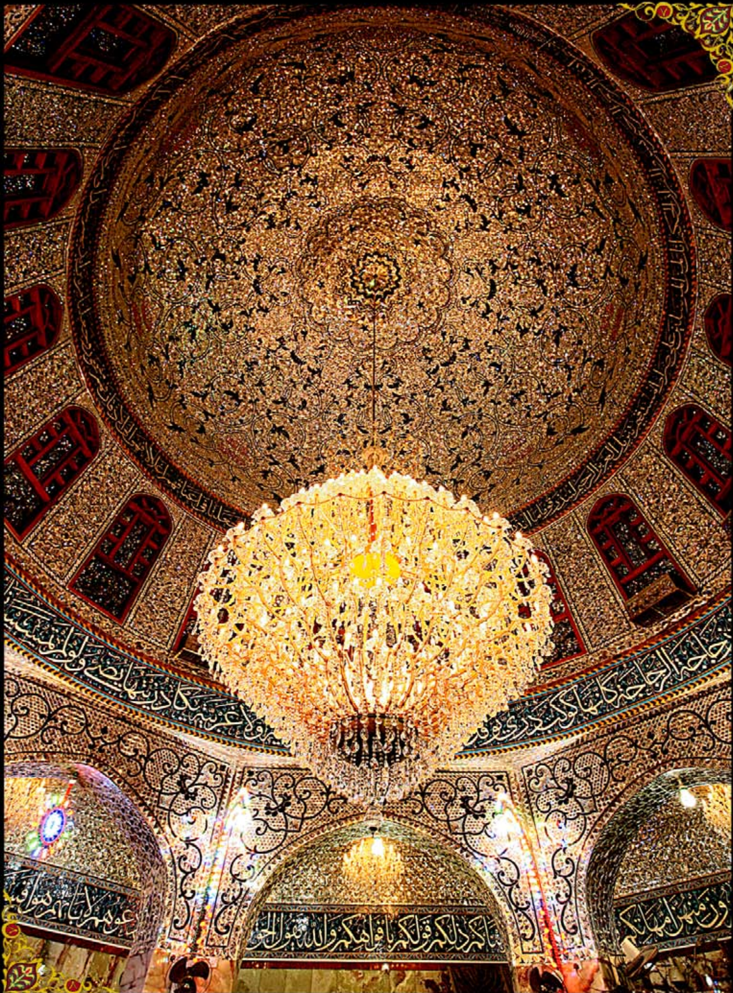
خيمة الامام الحسين في المخيم الحسيني