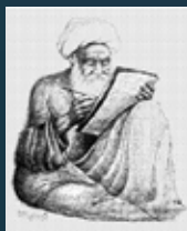
الشيخ محمد تقي الشيرازي

تاريخ كربلاء / عبد الجواد الكليدار شبكة كربلاء المقدسة تاريخ نجد / فليبي