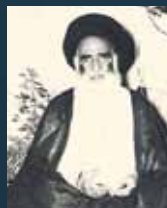
السيد مهدي الشيرازي