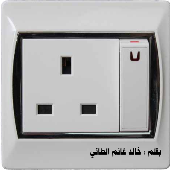
بقلم : خالد غانم الطائي

إذا عمدنا الى زر تشغيل المصباح وضغطنا عليه واوصلنا الدائرة الكهربائية فانه سيضيء وكلما زادت إضاءته اختفت حقيقته المادية أي اننا لا نرى المصباح بل نرى كتلة نورانية وإذا ضغطنا على الزر لنفصل الدائرة الكهربائية فان المصباح سيعود الى حقيقته المادية فنرى مادة تكوينه وهي الزجاج.. كذلك الانسان اذا اتصل بالله سبحانه (الله نور السماوات والارض) -سورة النور ٣٥- فانه سيضيء كما اضاء المصباح ويتسامى شأنه في الاضاءة (واضاءة الانسان ايمانية) اما اذا انفصل عن نور السماوات والارض فانه سيعود الى حقيقته المادية المُنهمكة في الشهوات والملذات والغرائز وبذلك تنقطع نورانيته.