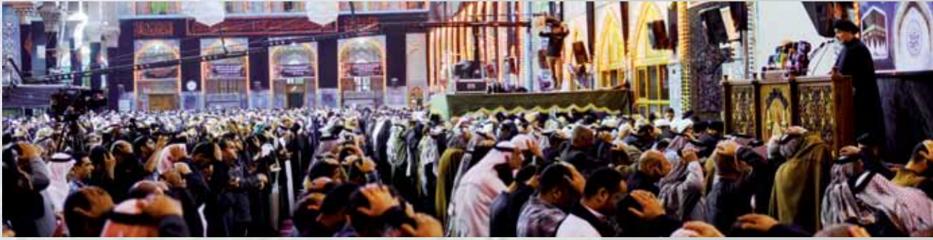
مستقاة من الخطبة الأولى لصلاة الجمعة بإمامة سماحة السيد أحمد الصافي، في ١٨/ محرم الحرام/١٤٣٥هـ الموافق ٢٢/١١/٢٠١٣م