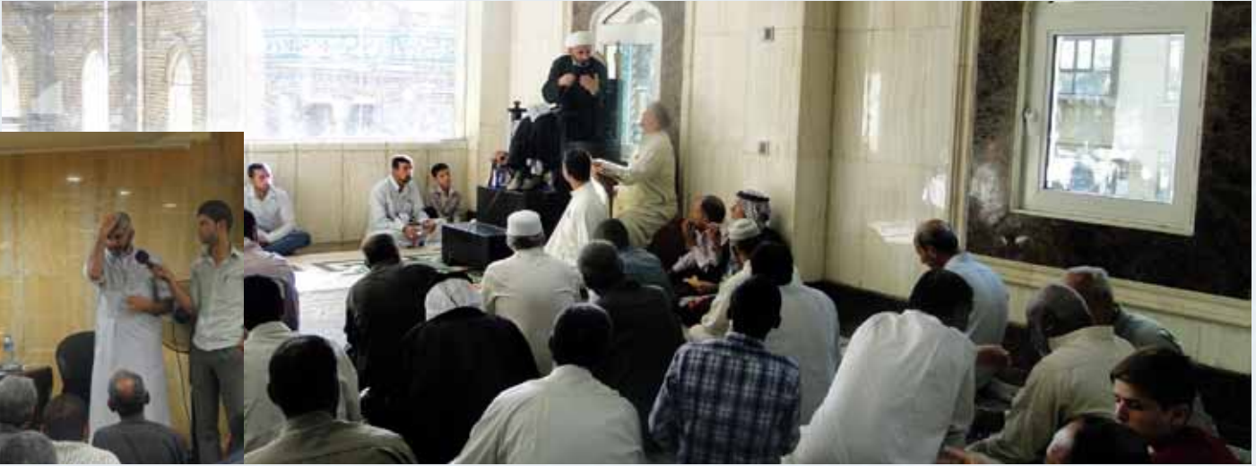
تقرير: احمد القاضي