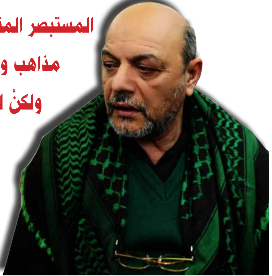
حوار: صفاء السعدي

المستبصر المقدوني حسيب آيدين: هناك مذاهب وطرائق متعددة في الإسلام ولكن لمذهب الشيعة طريق واحد وهو الأئمة الاثنا عشر