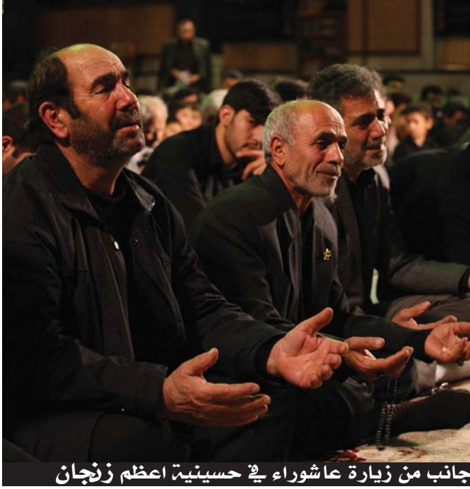
جانب من زيارة عاشوراء في حسينية اعظم زنجان

أجواء ولأثنية مليئة بالبكاء والخشوع لله تعالى والحزن على مصاب أهل البيت (عليهم السلام). كما شهد اليوم الثالث من الجمعة لحضور الفعاليات الثقافية المقامة وضمن الفعاليات المقامة تسجيل أسماء الزائرين الراغبين بزيارة الإنابة