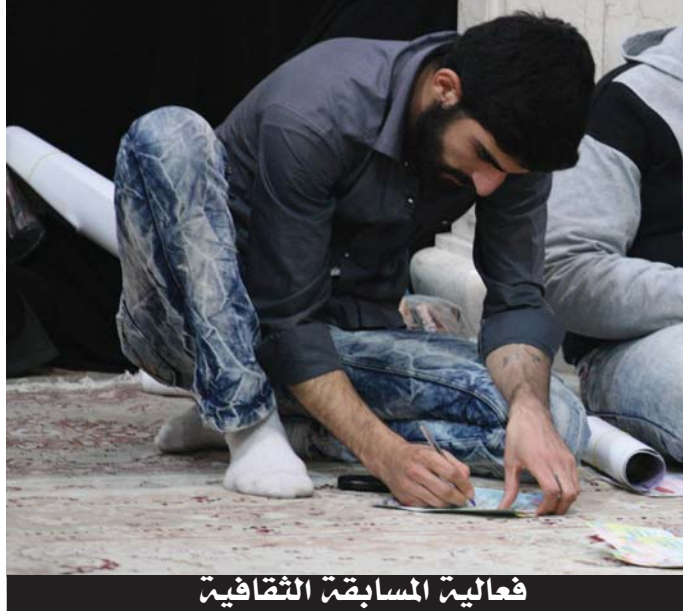
فعالية المسابقة الثقافية

تميز هذا اليوم بإقامة فعالية توقيع العهد على الالتزام بالحجاب الإسلامي بالنسبة للأخوات في إيران، التي شاركت فيها الآلاف من النساء والفتيات اللواتي عاهدن الإمام الحسين (عليه السلام) على الالتزام بالحجاب، فيما شارك الآلاف من النساء والرجال