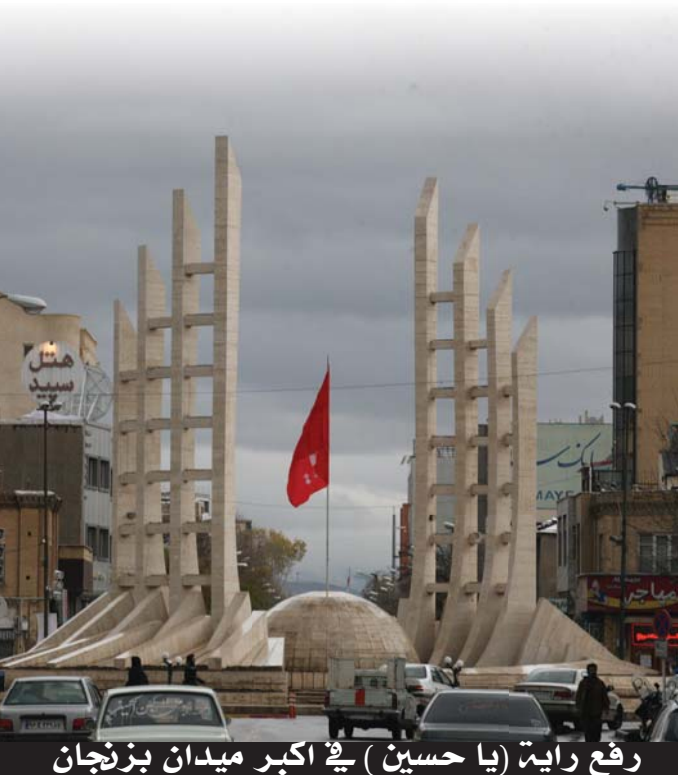
رفع راية (يا حسين) في أكبر ميدان بزنجان

استمر الأسبوع الثقافي في يومه الخامس باستقبال الزائرين لحضور الفعاليات الثقافية والمعروضات الفنية، حيث أخذت أعدادهم بالتزايد وسط أجواء حسينية جميلة.