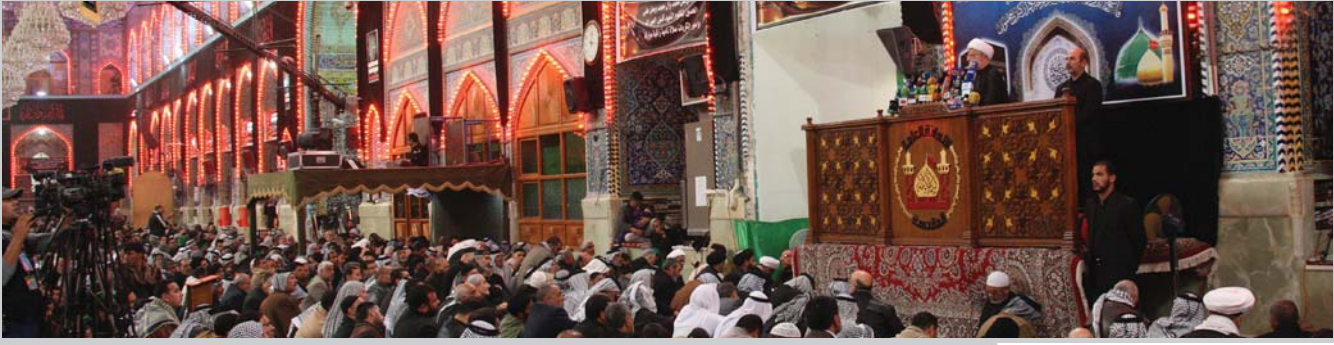
الخطبة الاولى لصلاة الجمعة بإمامة الشيخ عبد المهدي الكربلائي في ٩/صفر/١٤٣٥ هـ الموافق ١٣/١٢/٢٠١٣ م