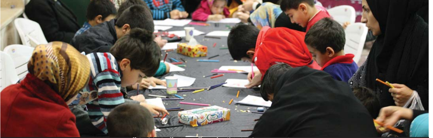
جانب من فعاليات شعبة رعاية الطفولة

الحسينية المقدسة بزيارات عديدة للمؤسسات الحكومية والدينية والثقافية، حيث التقى الوفد بمحافظ مدينة زنجان مع مجموعة من المسؤولين في المحافظة منهم رئيس مجلس المحافظة ورئيس البلدية، وقائد الشرطة و مسؤول حسينية أعظم زنجان، فضلاً عن زيارة مقر إذاعة وتلفزيون زنجان الذين رحّبوا جميعهم بمقدم سفراء الإمام الحسين (عليه السلام) وإحياء هذه الفعالية الثقافية الحسينية الكبرى في مدينة العشق الحسيني زنجان الإيرانية. يذكر أن فعاليات الأسبوع الثقافي شهدت حضوراً جماهيرياً تراوح بين (٨٥ - ١٠٠ ألف زائر)، فضلاً عن الحضور الإعلامي للوسائل الإعلامية الإيرانية، إضافة إلى قناة كربلاء الفضائية التابعة للعتبة الحسينية التي عملت على التغطية المباشرة للفعاليات المقامة ونقلها إلى الجمهور الحسيني في العالم.