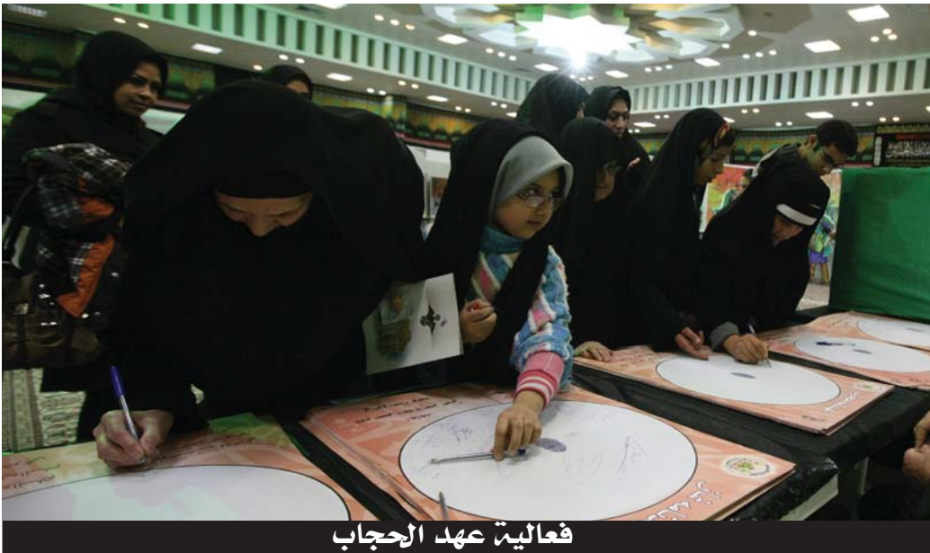
فعالية عهد الحجاب

شهدت أجنحة العتبة الحسينية الفنية حضوراً واسعاً لأهالي زنجان وبعض الوافدين من المدن الإيرانية الأخرى التي سارعت لحضور الفعاليات الثقافية والفنية التي خلقت أجواءً كربلائية حسينية. واستقبل اهالي مدينة زنجان وفد العتبة الحسينية المقدسة المشارك في الأسبوع الثقافي بباقات الورود تعبيراً عن سعادتهم بهذه الزيارة المباركة وإحياء هذه الفعالية الحسينية الكبرى، وأعربت جماهير زنجان عن سعادتها بقدوم الوفد الحسيني، ومقدمين شكرهم للإمام الحسين (عليه السلام) الذي أرسل سفراءه إليهم.