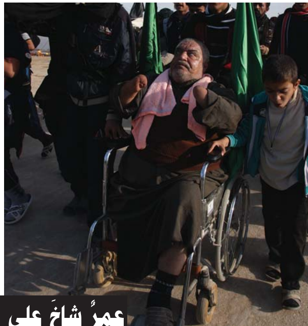
عمرُ شاخ على حبِّ الحسين