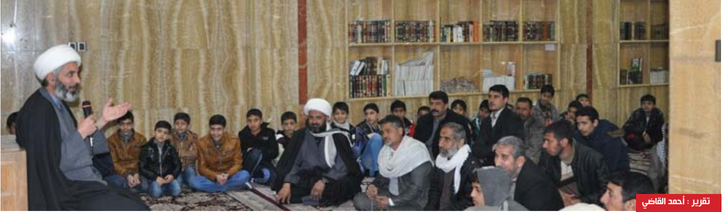
تقرير: أحمد القاضي

بأسئلة ذات اختيارات حصل بعضهم على درجات مابين (٨٠ - ١٠٠٪)، وتم تحديد موعد الحفل التكريمي حيث تم توزيع الهدايا لجميع المشاركين والاحتفاء بالمتفوقين»