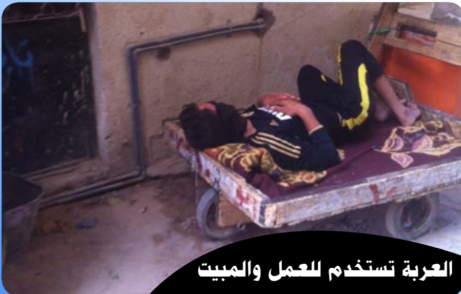
العربة تستخدم للعمل والمبيت

هنا يسأل المواطن كيف اضمن بانه لا يوجد من يستخدم خطأ معيناً باسمي استخداماً لا أخلاقياً او قد يكون إجرامياً واذا اعتمد لدى أجهزة الدولة الاستخباراتية لمعرفة صاحب الخط واكون انا فأصبح في قبضة الداخلية ، هذا الأمر قلته لموظف الشركة فقال لي لك الله الأمر متوقع جداً ، أي انا الان أعيش وغيري الكثير يعيش في خطر إجرام بعض أصحاب محلات بيع الخطوط!!!!