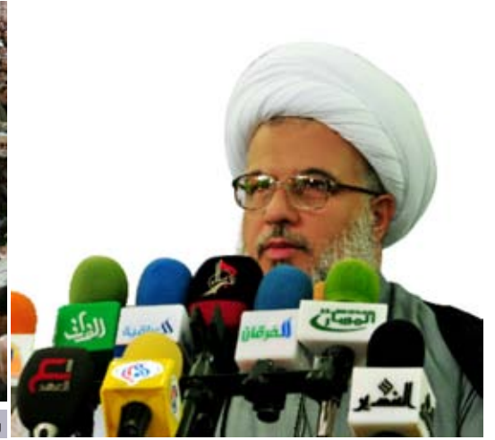
مستقاة من الخطبة الاولى لصلوة الجمعة بإمامة الشيخ عبد المهدي الكربلائي في 0/جمادي الاول/1430هـ الموافق 2014/3/7م