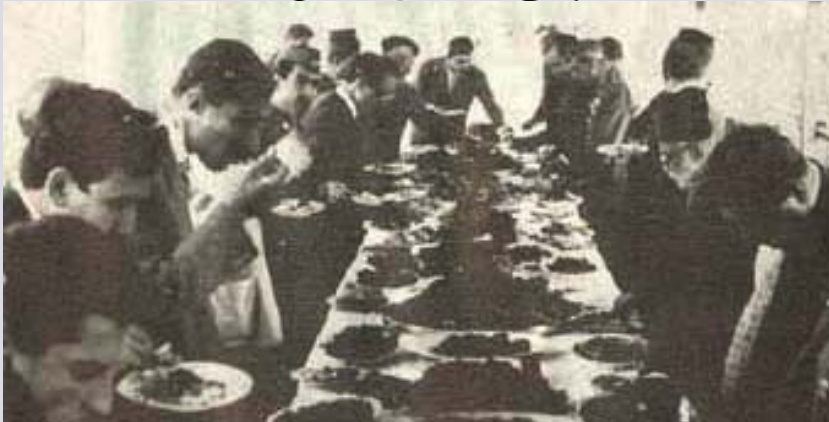
مواد إفطار الصائمين - رمضان كربلاء