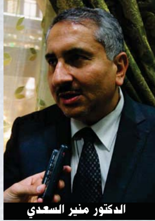
الدكتور منير السعدي