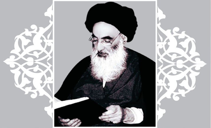
سَيِّدُ الرَّجْعِ الرَّجِيءِ آيَةَ اللَّهِ الْعَظِيمَةَ السَّيِّدَ عَلِيَّ بْنَ الْحُسَيْنِ السَّيِّدِ

السؤال: على من تقع مسؤولية التربية من ناحية المسائل الشرعية وغيرها من الأمور الحياتية في الشرع على الأم أو الأب؟ أو على الاثنين معاً وإذا كان الوالدان منفصلين على من تقع المسؤولية؟ الجواب: هذا من شؤون الحضانة وهي مشتركة بينهما الى ان يبلغ الولد سنتين ثم تختص بالأب سواء انفصلا ام لم انفصلا.. السؤال: هل يجوز ضرب الأولاد؟ الجواب: اذا توقف التأديب على أعمال القوة والضرب جاز والاحوط لزوماً ان لا يتجاوز في ذلك ثلاث جلدات وان يكون برفق السؤال: هل يجوز ضرب الاحمرار البدن او اسوداده وفي جوازه بالنسبة للبالغين إشكال فالاحوط لزوماً تركه. الجواب: لا يجوز للأب مراقبة الولد أو البنت في فحص موقعه أو الجوال ليرى مع من يتحدث صوتاً له؟ الجواب: يجوز بمقدار الضرورة فيما يتوقف عليه صيانتة من المحرمات. السؤال: التبنني غير مشروع في الإسلام ولايصبح المتبني ولداً للمتبنية والمتبني بل هو أجنبي عنهما بالمرّة. الجواب: هناك طلاب ممن أدرسهم في المدرسة يرغبون بإرادتهم بان أقوم بتدريسهم في البيت لقاء اجر معين فهل يجوز ذلك؟ الجواب: لا مانع من ذلك. السؤال: هل يجوز ضرب التلميذ من قبل الأستاذ؟ الجواب: لا يجوز ضرب التلميذ في المدرسة بدون إذن وليه أو المأذون من قبله بتاتا.