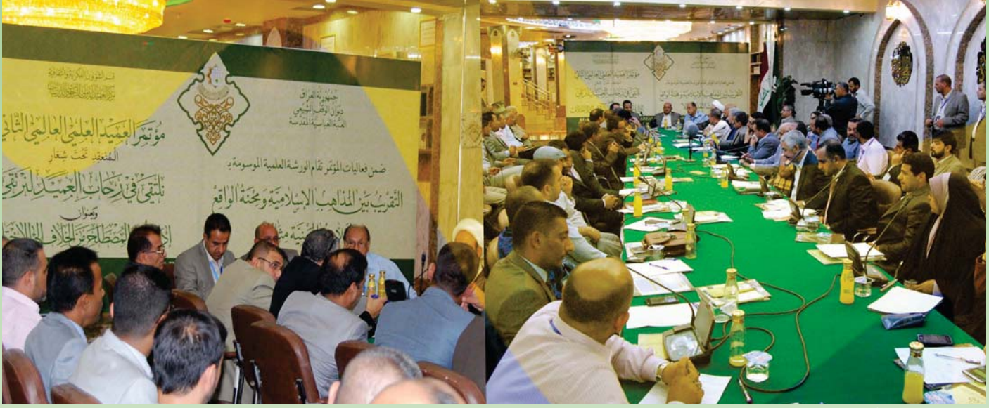
تقرير: ضياء الاسدي

يواجهها النقد الأدبي والتي ما زالت تؤثر سلباً في شتى ضروب الممارسة النقدية الأدبية وعلى الدراسات والبحوث الأدبية، سواء كان ذلك في الحقل الأكاديمي أو في حقل الدراسات النقدية المنشورة في الدوريات المتخصصة»، مضيفاً ان «هذه المشكلة لم تستنفد بعد كل فرص البحث فيها وتحديد أسبابها، ناهيك عن معالجة هذه الأسباب. ولعل دراسة جهد أي ناقد أو باحث، أو حضور مناقشة آية رسالة أو أطروحة سيضعنا في مواجهة هذه الحقيقة الواضحة، حتى باتت الشكوى المبررة من فوضى المصطلحات أمراً شائعاً. وبداية لا بد لنا من التأكيد أن مشكلة المصطلح جزء من مشكلة أكبر هي مشكلة المنهج في الدراسات الإنسانية عامة، وفي النقد الأدبي خاصة».