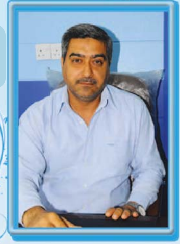
*إعداد: قاسم عبد الهادي

طريق الفم. نصيحة طبية للوقاية من هذا المرض:- للوقاية من هذا المرض يُنصح باستعمال العلاج لكافة أفراد العائلة او الأشخاص الملامزين وعلى تماس مع المصاب حتى وان لم تظهر عليهم أعراض الإصابة، ومن ناحية اخرى يجب الحفاظ على الخصوصية الشخصية باستعمال المناشف والأغطية وأدوات الاستحمام وكذلك الملابس «اي عدم استعمال أدوات الآخرين» وتبديل أدوات الاستحمام بأخرى جديدة «الليفة» بعد الاستعمال، وهناك نصيحة مهمة جدا وهي يجب غسل الأغطية والملابس والمناشف بالماء الحار (٦٠ درجة مئوية فما فوق) وتجفيفها بالبخار وينصح ايضا باستعمالها بعد أسبوع من الغسل، اما الأدوات التي لا تغسل يجب وضعها في كيس بلاستيكي وتغلق بأحكام وتترك لمدة أسبوع، فضلا عن تنظيف الأرضيات «الكاربت، السجاد والاثاث» باستعمال المكنس الكهربائية وإتلاف كيس السحب حالا بعد التنظيف، وأخيرا ومن النصائح المهمة ايضا الاهتمام بالنظافة الشخصية ونظافة المكائن والملابس والمتعلقات الاخرى.