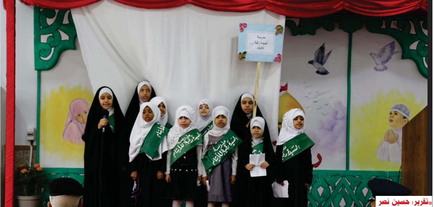
تقرير: حسين نصر

يحتوى على غرفة مدير الروضة وغرف الملاحظين والانتظار ومطبخ وصالة ألعاب وبالإضافة الى مجموعة صحية، والطابق الثاني يحتوى على صالة السينما وغرف الطباعة والإدارة وغرف منام وغرف الدروس ومجموع صحية عدد (٢)، وقد تم وضع تصميم خاص يتلاءم مع الطفولة في العراق حيث تقدم لهم العناية المناسبة لهم من تدريس خاص مرتبط بمنهج آل البيت (عليهم السلام) وكذلك الرعاية الصحية الخاصة بهم تتناسب بما تستحقه الطفولة في العراق». ولفت الشاهر إلى أن «مشروع روضة «الحسيني الصغير» يعد نموذجاً حياً للمشاريع التربوية التي تقيمها العتبة الحسينية المقدسة، وهو من المشاريع الإستراتيجية في محافظة كربلاء المقدسة».