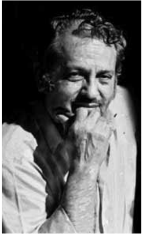
كتابة: علي الشاهر